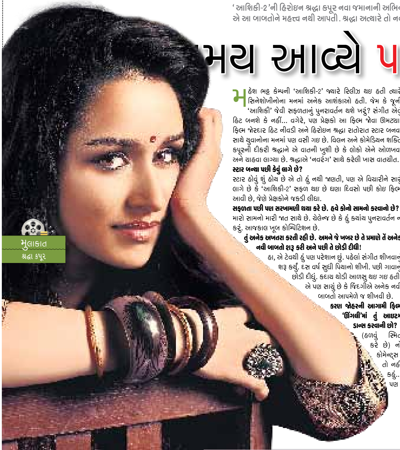
મુલાકાત શ્રદ્ધા કપૂર